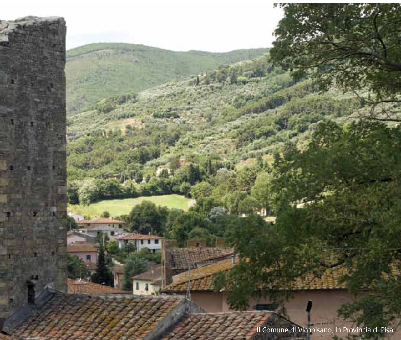
Il Comune di Vicopisano, in Provincia di Pisa

Serve una vera e propria alleanza. E prenderemo un'iniziativa. Noi riconosciamo il ruolo decisivo delle Regioni e, poiché siamo disponibili ai cambiamenti, diciamo: cambiamo insieme un modello di Stato che non funziona e che indebolisce la risposta pubblica. Riconquistiamo insieme margini d'intervento da grande Paese europeo. Superiamo insieme le frontiere, per nuovi scenari competitivi. Perché le città senza le Regioni non hanno massa critica sufficiente. Ma le Regioni senza le città spesso hanno politiche sulla carta, inefficaci.